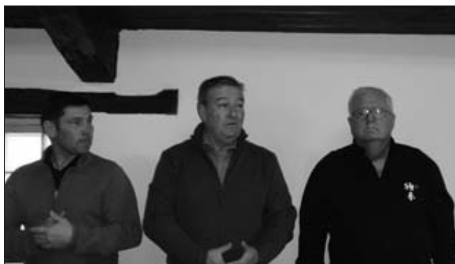
M. le Maire accueille les participants.