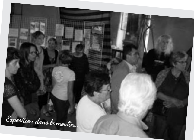
Exposition dans le moulin...

Plusieurs idées ont émergées, nous vous tiendrons au courant et sûrement à l'année prochaine.