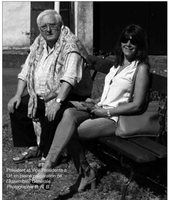
Président et Vice Présidente à Urt en pleine préparation de l'Assemblée Générale...