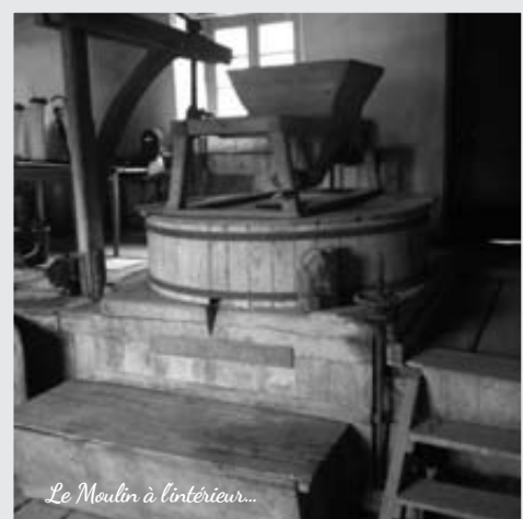
Le Moulin à l'intérieur...