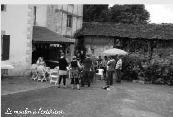
Le moulin à l'extérieur...