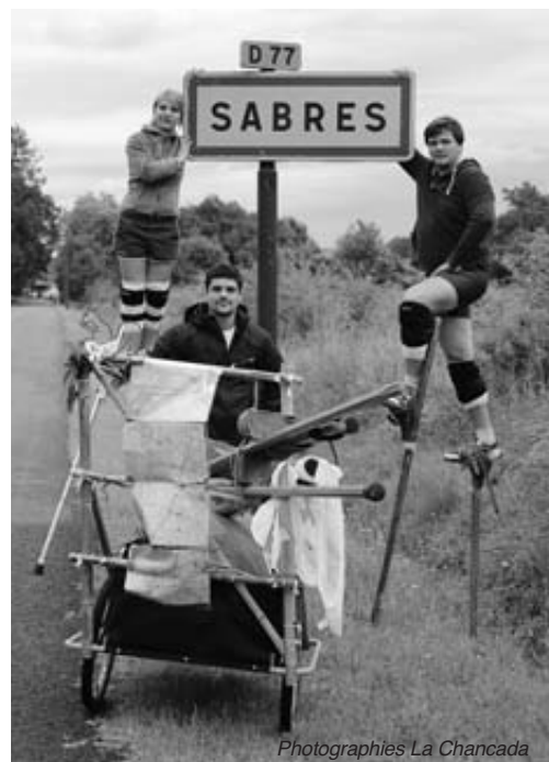
Photographies La Chancada