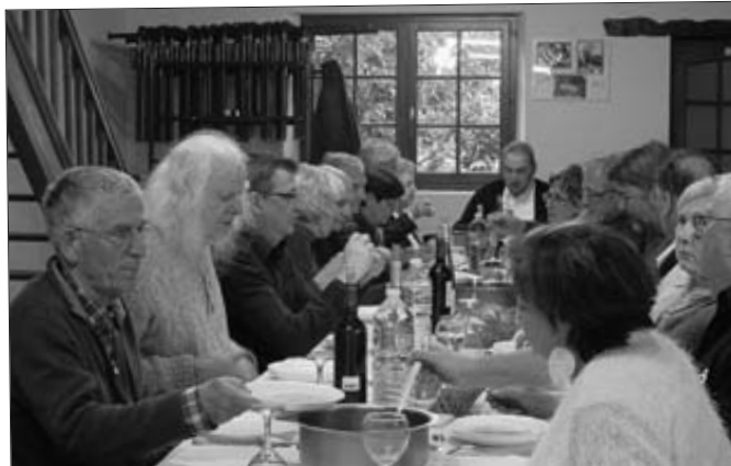
Une partie des présidents dégustant le repas de F. Lagareste.

Après l'assemblée générale et l'apéritif offert par la municipalité de St Barthélémy, un excellent repas nous fut servi par Francis Lagareste, traiteur local ( faire d'abord travailler le local reste toujours un des objectifs de l'association. )